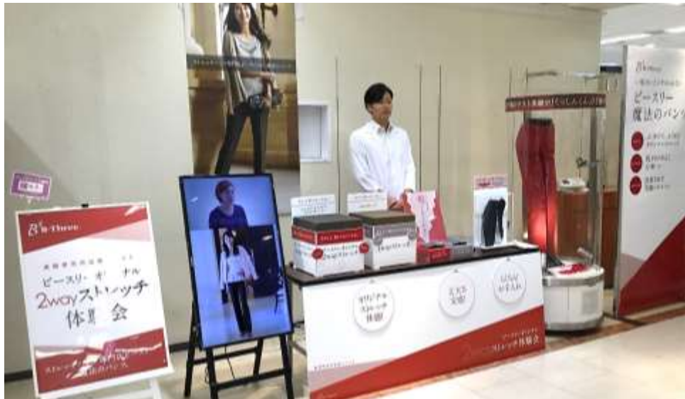
「ビースリーオリジナル 2Wayストレッチ体験会」 京王百貨店新宿店での イベント