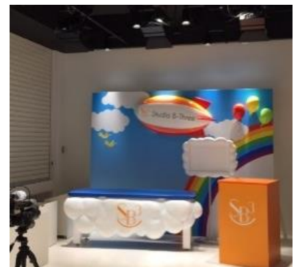
「おもてなし研究所」にある、ニュース番組作成のための撮影スタジオ

『おもてなし研究所』開設にあたり、まずは「人材育成」「情報共有」の仕組みづくりを実施。働く一人ひとりをおもてなしのプロフェッショナルに育成し、お客様に喜んでいただけるブランドを目指しています。