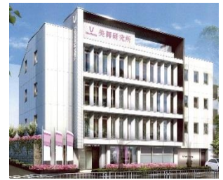
「美脚研究所」外観（神戸市）