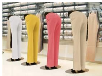
オリジナルの腰下マネキン

こうして生まれるストレッチパンツは、縦横斜め 360°に伸び縮みし、驚くほど快適。一度はいたらやめられない“魔法のパンツ”と呼ばれています。サイズは3号～21号の10サイズ展開。価格は、10,900円+税～。