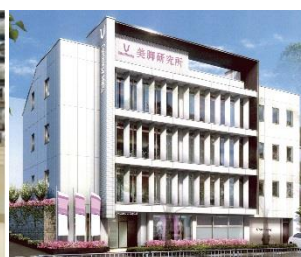
「美脚研究所」外観（神戸市）