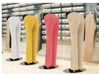
オリジナルの腰下マネキン

こうして生まれるストレッチパンツは、縦横斜め360°に伸び縮みし、驚くほど快適。一度はいたらやめられない“魔法のパンツ”と呼ばれています。サイズは3号～21号の10サイズ展開。価格は、10,900円+税～。